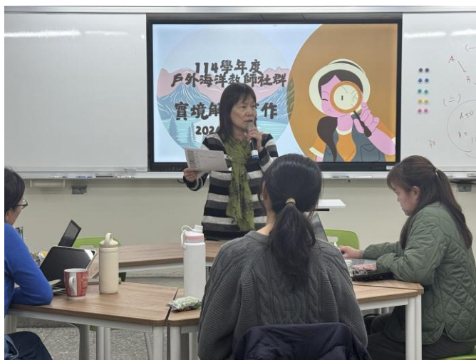
學管科承辦人業務說明