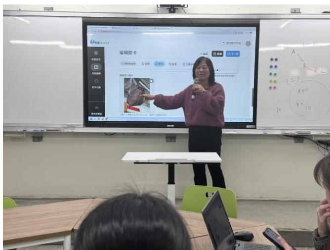
關卡解說：邵族的「蕨」世珍寶（逆羽裡白）