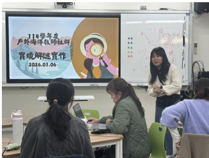
副召集人協助指導實境解謎關卡之規劃