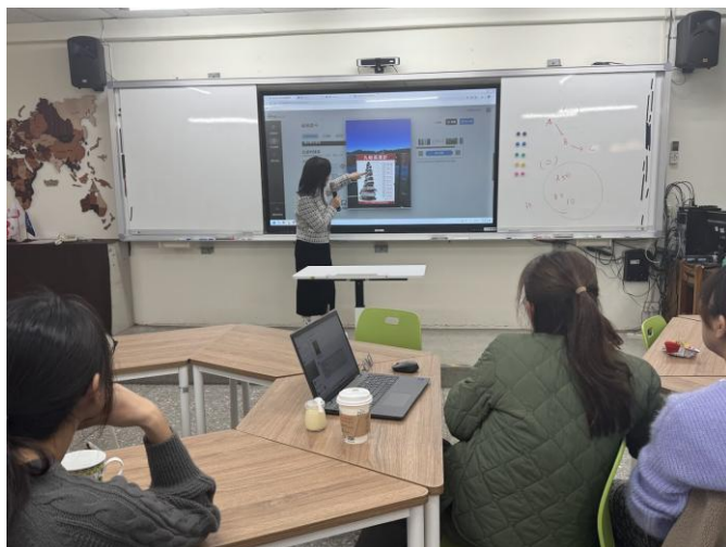
關卡解說：水位密碼的召喚（九蛙疊像）