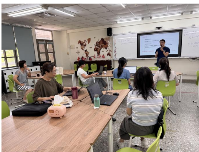
協助教師共備社群完成實境解謎教材設計與分析