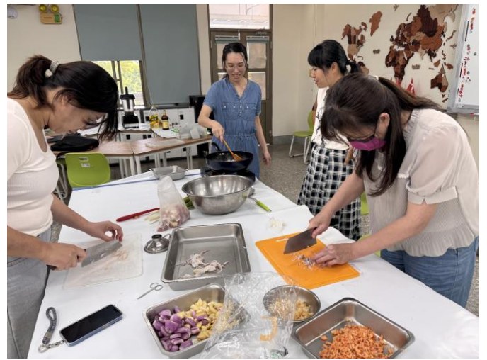
團隊合作製作美味 XO 醬，體驗食材處理與實作樂趣