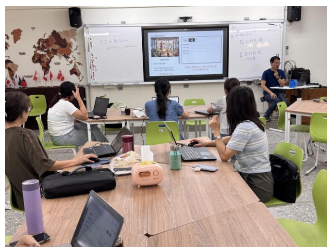
運用多元解謎素材與線索圖，強化學習互動與推理能力